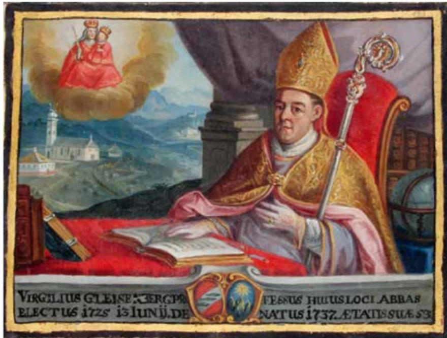
Abb. 1: Abt Virgilius Gleissenberger, Porträtdarstellung im Ossiacher Äbtebuch (Museum der Stadt Villach, C 827, S. 133); im Hintergrund die Wallfahrtskirche Maria Elend.

(Geschichtsverein für Kärnten: Carinthia I )